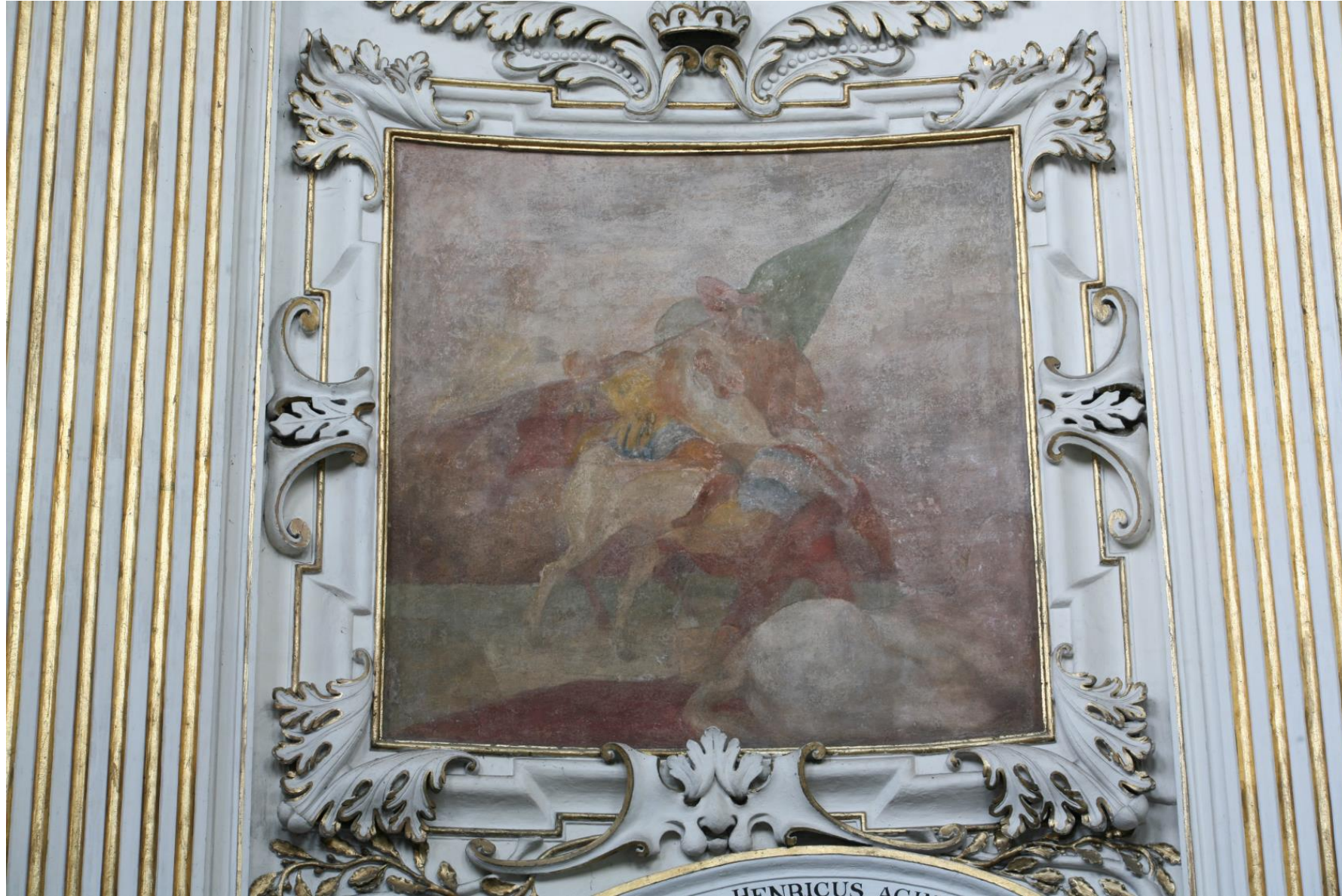
Matthias Rauchmiller / Joseph Langer, Śmierć Henryka Pobożnego , 1679, Mauzoleum Piastów Śląskich w Legnicy