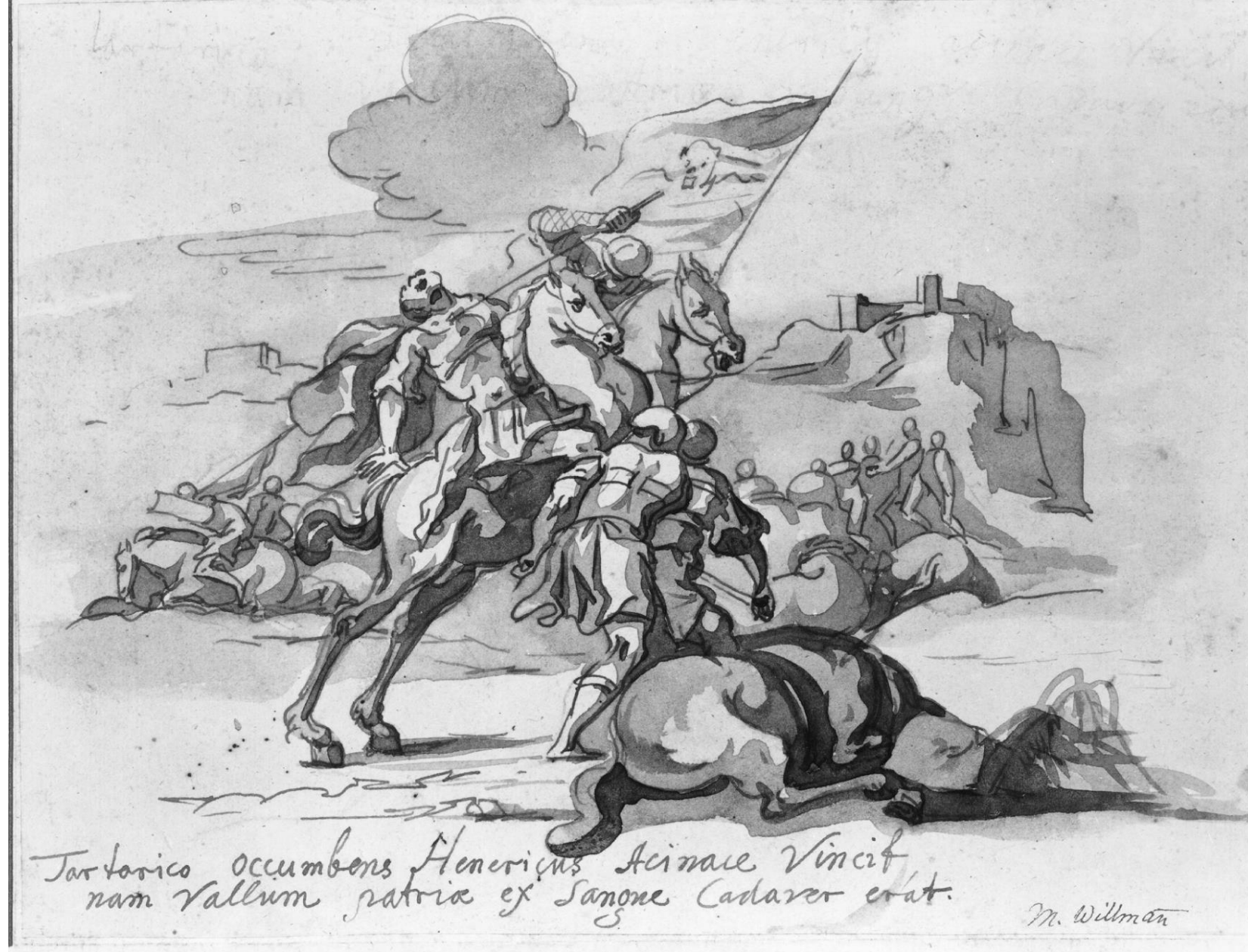
Johann Jacob Eybelwieser, Śmierć Henryka Pobożnego w bitwie na Legnickim Polu , rysunek piórkim w tuszu na papierze, przed 1723, Staatliche Museen zu Berlin