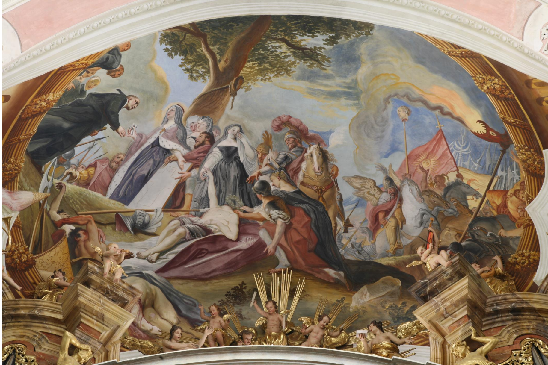
Cosmas Damian Asam, Znalezienie ciała księcia Henryka Pobożnego , 1733, kościół p.w. Podwyższenia Krzyża Świętego i św. Jadwigi Śląskiej w Legnickim Polu