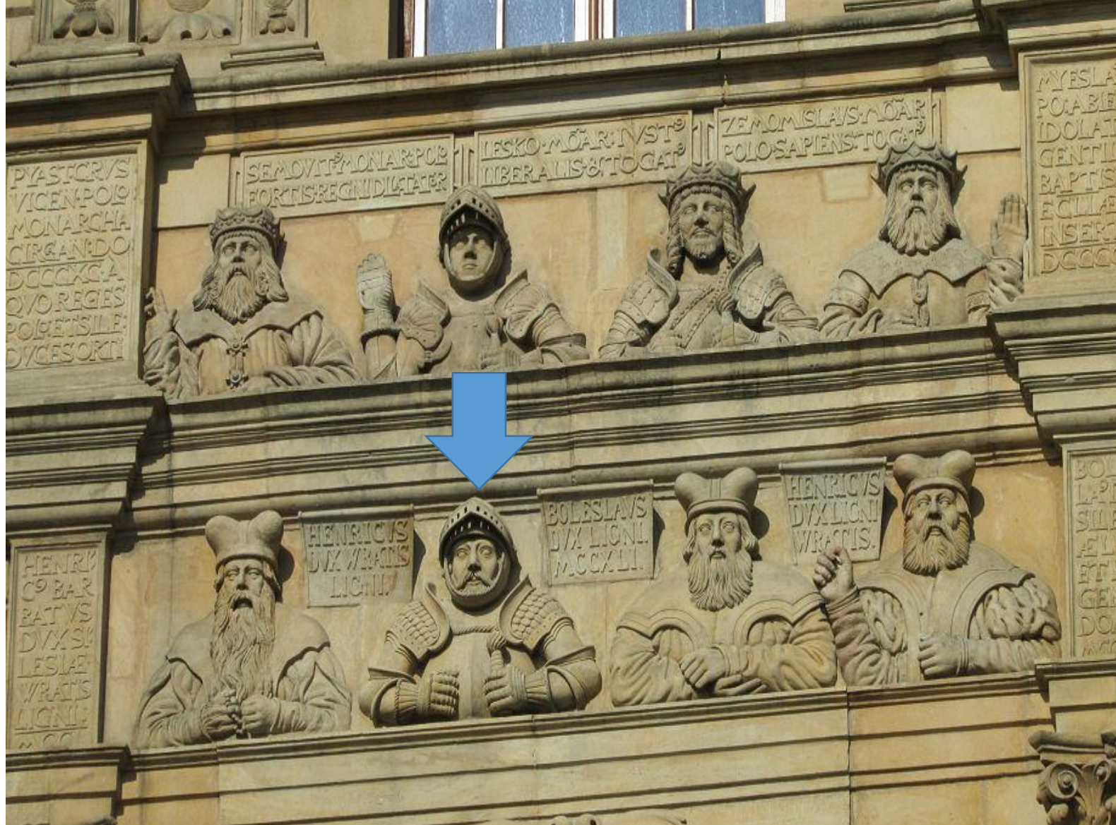
Warsztat Parrów, Galeria Antenatów , Brama zamkowa w Brzegu, ok. 1552