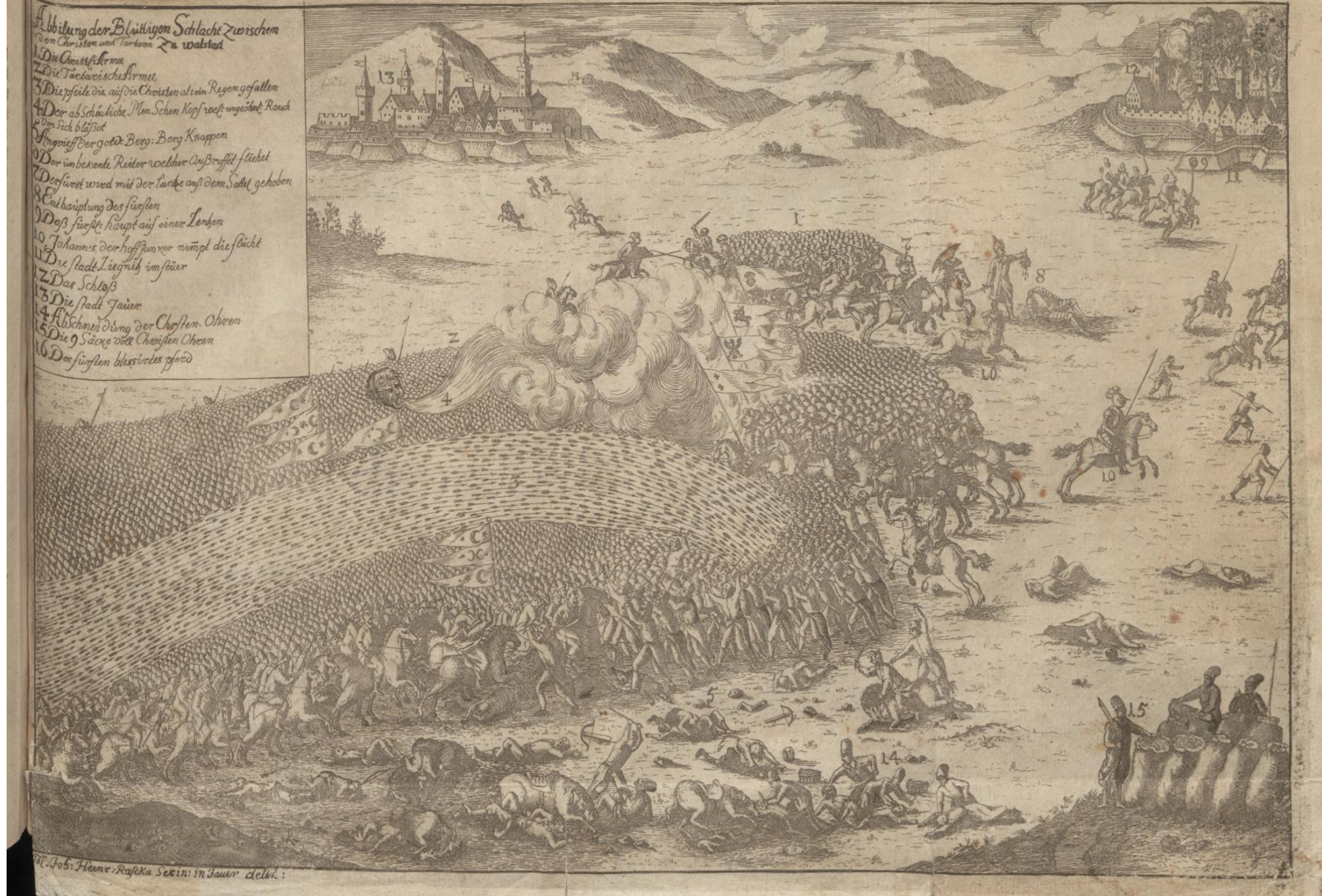
Johann Ruscka, Bitwa między chrześcijanami a Tatarami pod Wahlstadt , ok. 1725, grafika do kazania Christopha Adolphiego, Biblioteka Uniwersytecka we Wrocławiu