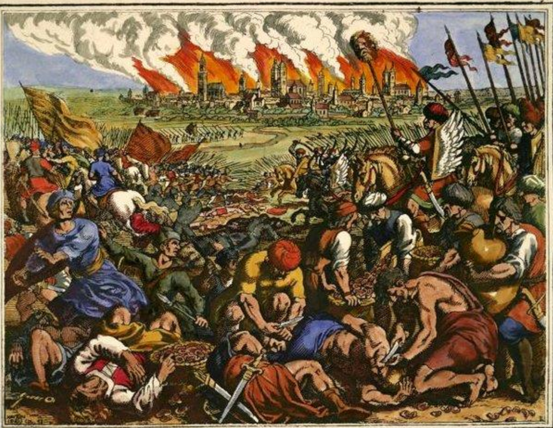
Malthäus Merian St., Wielka klęska chrześcijan pobitych przez Tatarów, miedzioryt za: J.L. Gottfried, Historische Chronica , 1630