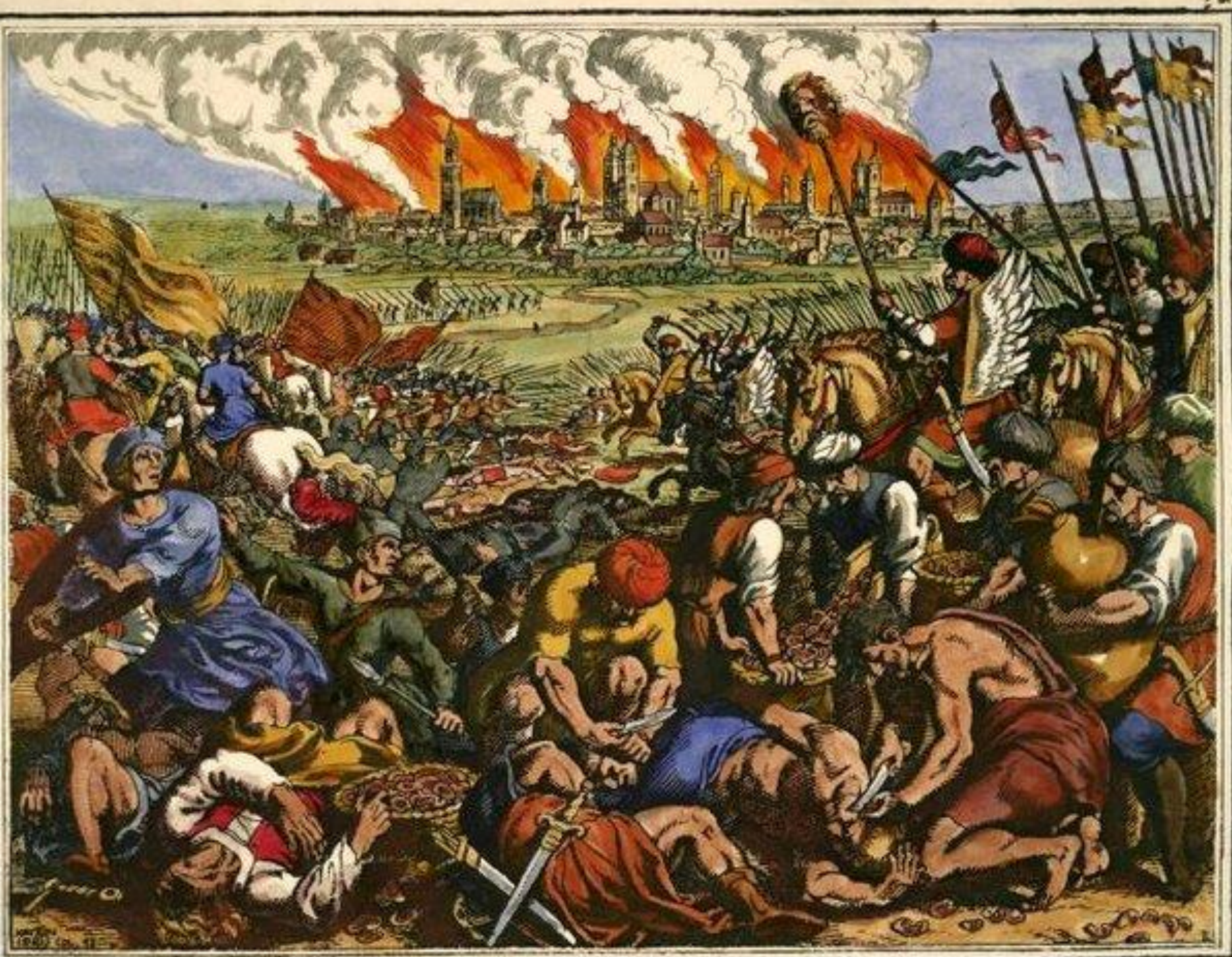
Malthäus Merian St., Wielka klęska chrześcijan pobitych przez Tatarów, miedzioryt za: J.L. Gottfried, Historische Chronica, 1630