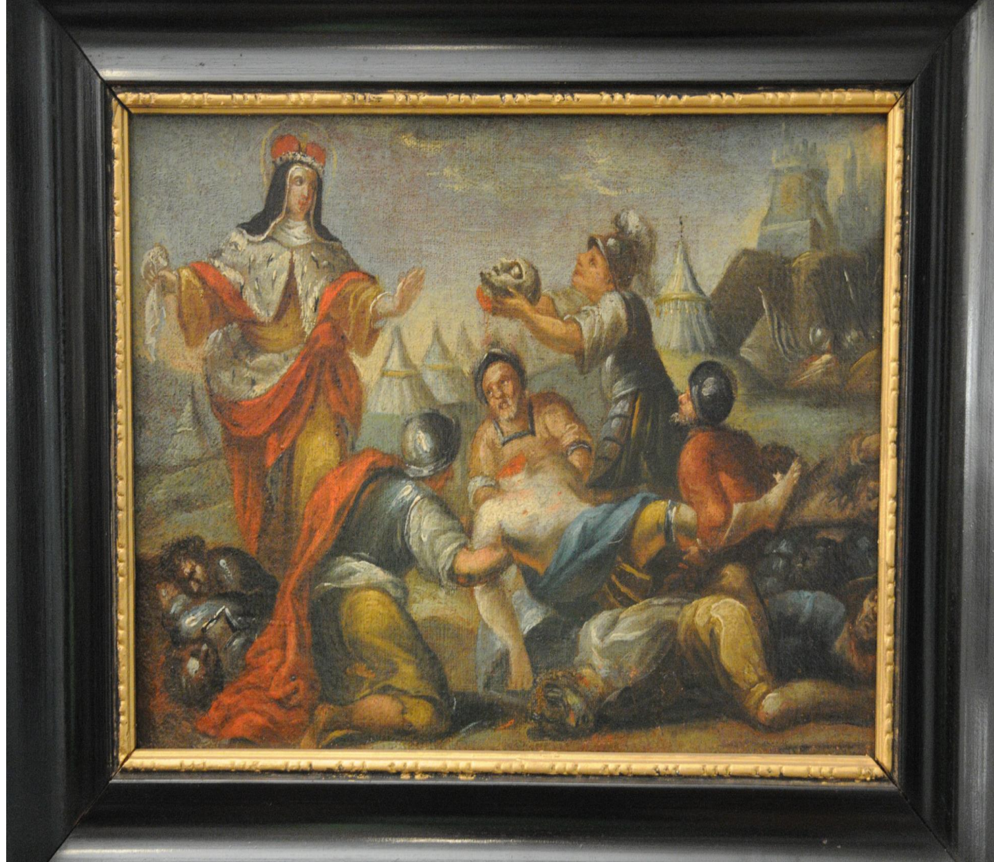
Twórca nieznany, Odnalezienie ciała Henryka Pobożnego przez św. Jadwigę , koniec XVII wieku, Muzeum Miedzi w Legnicy