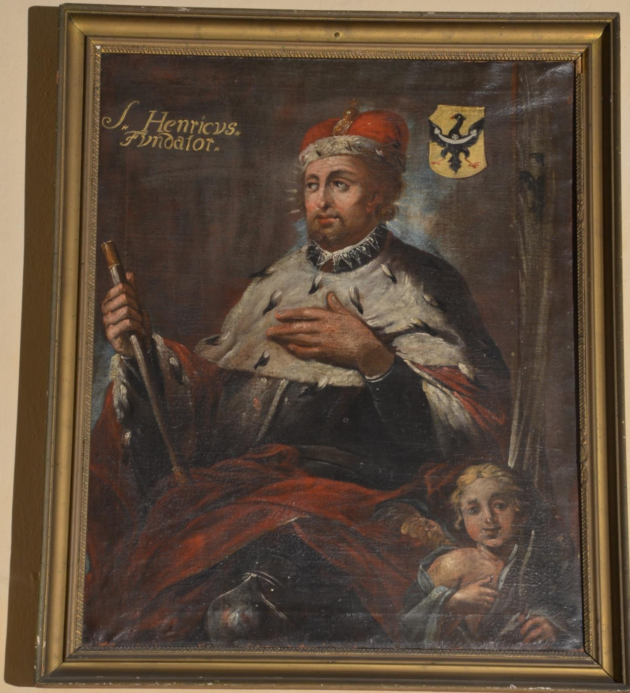
Nieznany śląski malarz, Święty Henryk Pobożny , 1730, kościół klasztorny sióstr urszulanek we Wrocławiu